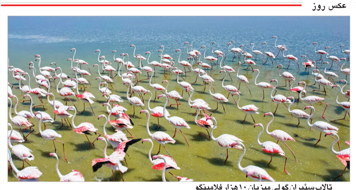
تالاب سفیران گولی میزبان ۱۰ هزار فلامینگو

سبک زندگی این موارد زندگی مشترک شما را نابود می کند! در همه روابط با گذشت زمان وقتی زوجین با یکدیگر راحت می شوند برخی رفتارها عادی خواهد شد و به همین خاطر بعد از آن از انجام کارهای کوچک دست می کشند و کسالت و بی علاقهگی به وجود می آید که کاملاً طبیعی است. اما برای تغییر اوضاع به یک روال جدید نیاز دارید بنابراین می توانید برای تعطیلات به یک مکان جدید بروید و سرگرمی داشته باشید. دیوار کشی هر زندگی در سطوح مختلف درگیری و کشمکش خواهد داشت اما اگر سنگ اندازی کنیم از نظر احساسی خود را از همسرمان بیشتر دور می کنیم. هنگامی که درگیری و اختلاف در رابطه ایجاد می شود از هم فاصله می گیریم یا سعی می کنیم موضوع را تغییر دهیم و یا به خود اجازه می دهیم در اختلاف حضور بزرگ ترین هدیه ای که می توانیم به همسرمان بدهیم، حضور عاطفی است. زمانی را برای گفت و گو با همسر یک کنترل گری تمایل به کنترل شریک زندگی ریشه در ترس و ناامنی دارد و هنگامی که رفتار کنترل گری وارد یک رابطه می شود در واقع می توان گفت یک ترس اساسی وجود دارد و ممکن است این ترس از ابهام آینده نشأت بگیرد یا ترس از داشتن یک همسر وحشتناک باشد و تا زمانی که با ناامنی های خود روبرو نشویم، شریک زندگی رنج خواهد برد. مقایسه با وجود سهولت در برقراری ارتباط از طریق پیام های متنی و سایر رسانه های اجتماعی، و سوسه مقایسه در برخی زوجین بیشتر شده است. مقایسه همسر فعلی با همسر سابق یا دیگران یک فاجعه است و کار درستی نیست و باید بدانید هیچ فردی همه معیارها را ندارد. شما با مقایسه همسر فعلی خود با همسر قبلی تان، به از بین بردن زندگی مشترک خود دامن می زنید. عادی انگاری