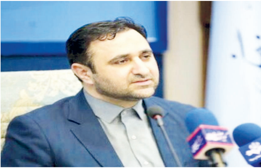
معاون گردشگری کشور خبر داد؛