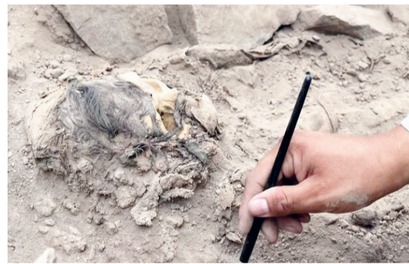
مومیایی خارج کردند. محققان معتقدند که این مومیایی احتمالا به تمدن «مانچای» (Manchay) تعلق داشته که در

فاصله ۱۵۵۰ تا ۱۰۰۰ پیش از میلاد در دره های لیما شکل گرفت. مردم این تمدن معبد هایی را بنا کرده بودند که به شکل L و به سمت طلوع خورشید ساخته می شدند. به گفته کاوشگران این مومیایی درون مقبره ای کشف شد که در مرکز یک معبد L شکل قرار داشت و در حالی پیدا شد که درون پارچه ای پنبه ای قرار داده شده بود. باستان شناسان علاوه بر این مومیایی، بقایای ذرت، دانه و برگ کوکا را نیز کشف کردند که گمان می رود به عنوان پیشگام ارائه شده بودند.