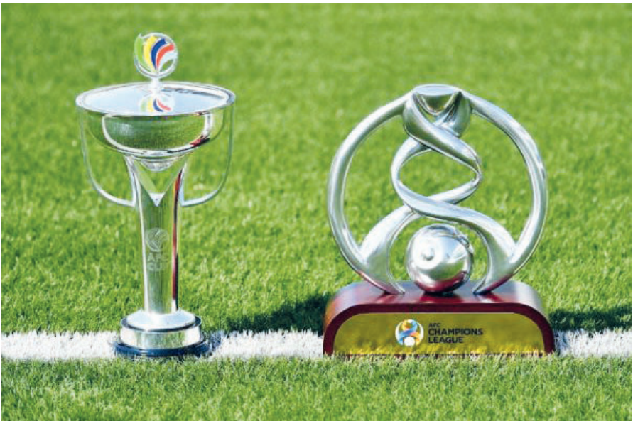
رقابت شدید در لیگ ایران برای کسب سهمیه حضور در تورنمنت مشابه لیگ اروپا و لیگ کنفرانس آسیایی بود. قرار است جزئیات دیگر از نحوه برگزاری سه سطح مسابقات آسیا اطلاع رسانی شود.

خداحافظی خواهد کرد. پیش از این اعلام شده بود که از فصل بعد، آسیا نیز همچون اروپا، مسابقات باشگاهی قاره را در سه سطح برگزار می کند، اما سطح نخست چه ویژگی هایی خواهد داشت؟ * در این مسابقات ۲۴ تیم شرکت خواهند کرد که ۱۲ تیم از منطقه غرب و ۱۲ تیم از منطقه شرق خواهند بود. * گروه بندی به صورت دو گروه ۱۲ تیمی خواهد بود و نمایندگان شرق و غرب با یکدیگر دیدار خواهند کرد. * هر تیم ۴ بازی خانگی و ۴ بازی خارج از خانه برگزار می کند و در مجموع با هشت تیم مختلف بازی خواهد داشت. * پس از پایان هشت بازی، ۸ تیم برتر هر منطقه راهی مرحله یک هشتم نهایی خواهند شد: به عبارتی ۱۶ تیم. * بازی های مرحله یک هشتم نهایی به صورت رفت و برگشت