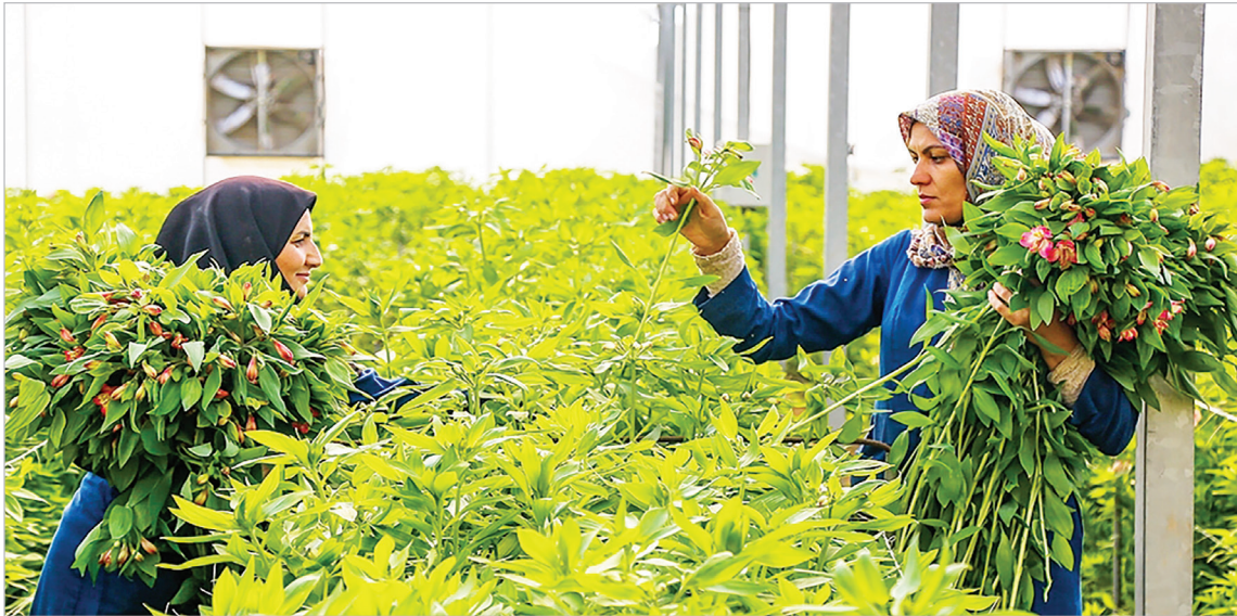
پرورش گل آلسترو میریا - اصفهان