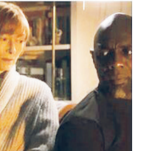
آن زن گفست - هزینه تولید ۳۲ میلیون دلار؛ فروش جهانی ۱۰۶ میلیون دلار