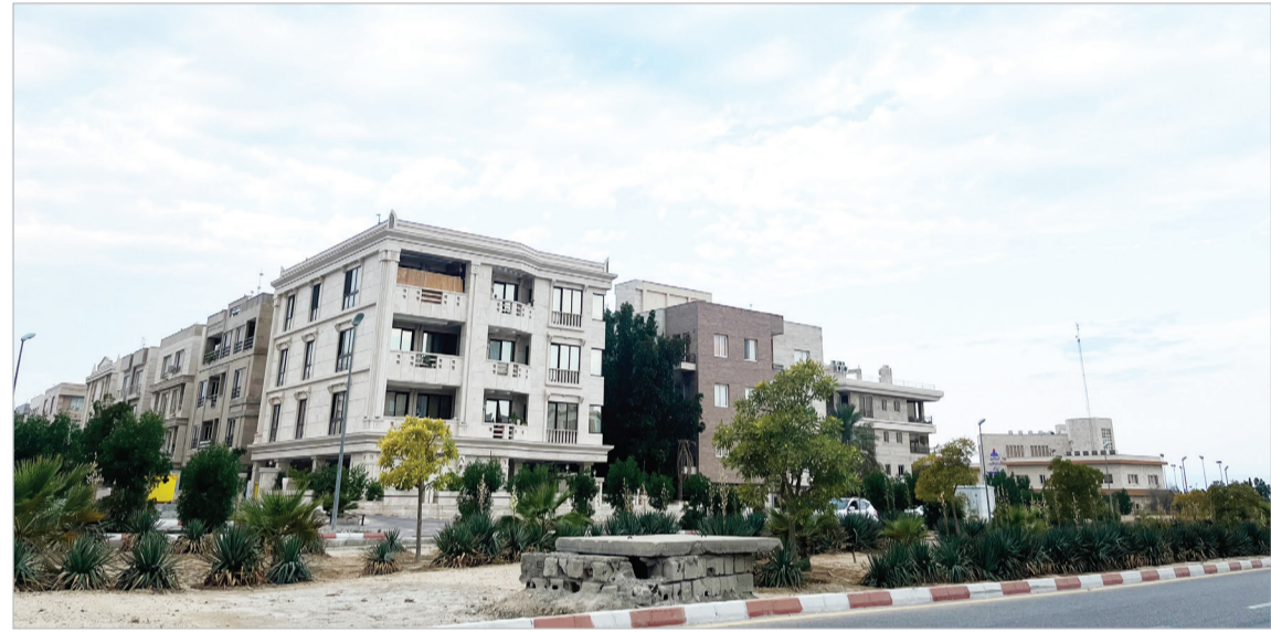
هستی هاشم زاده (کیشوند)