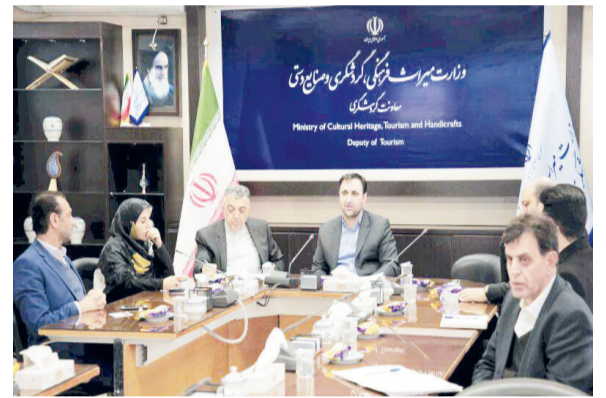
گروه گردشگری - معاون گردشگری و وزارت میراث فرهنگی، مجازی با رایزنان اقتصادی وزارت

سرپرست پژوهشگاه باستان‌شناسی تأکید کرد: تهیه اطلس باستان‌شناسی حوزه خلیج فارس را در برنامه داریم و با چینی‌ها تفاهم‌نامه‌هایی برای انجام باستان‌شناسی زیر آب منعقد کرده‌ایم.