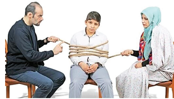
نگران کننده است: «والدین اغلب از تغییرات سستی فرزندشان احساس نگرانی می کنند و به همین خاطر همگام و همراه با فرزندانشان رشد نمی کنند. این دسته والدین، برخی تغییرات در نوجوانان را تساب نمی آورند و به همین دلیل، شیوه کنترل گری را در پیش می گیرند.» این روانشناس ادامه می دهد:

«والدین کنترل گری چون نمی توانند رفتار نوجوانان را کنترل کنند، تلاش می کنند هیجانات خودشان را کنترل نمایند؛ در واقع والدین با پنهان کاری نوجوان، احساس ناخوشایندی پیدا می کنند و تلاش می کنند تا با کنترل گری از شسر احساسات ناخوشایند خودشان رها شوند»