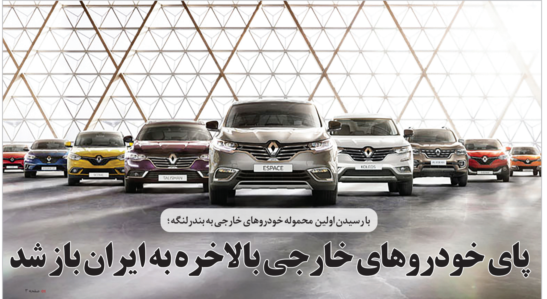
بارسیدن اولین محموله خودروهای خارجی به بندر لنگه؛