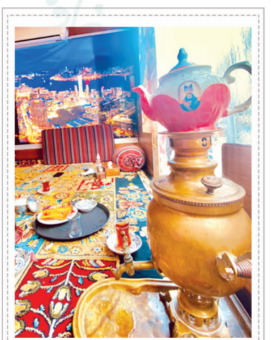
کاسه کباب اردبیلی

پشت بازار زیتون، جنب نمایشگاه اتومبیل پارس ۰۹۳۴۷۶۸۶۶۳۳ - ۰۹۳۴۷۶۸۶۶۳۳ ۰۷۶۴۴۴۲۰۴۴۷ - ۸ «ارسال سراسر چیزه»