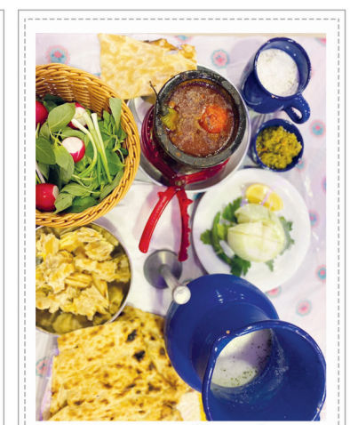
دیزی سنگی اردبیلی