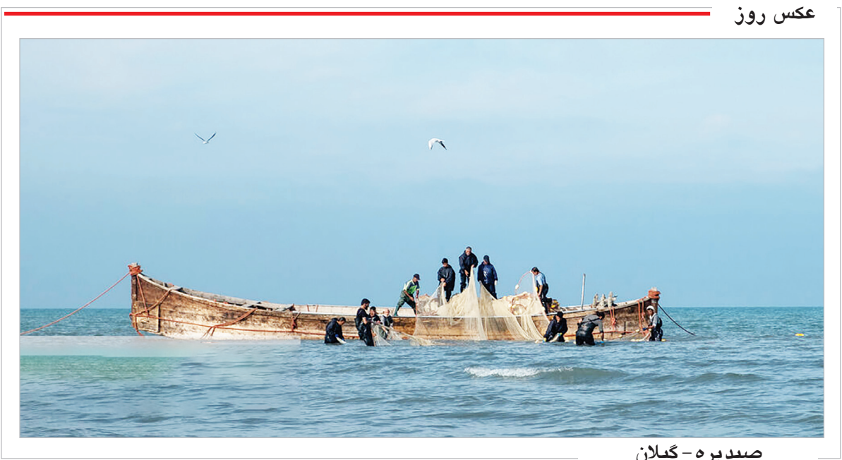
صید پره - گیلان