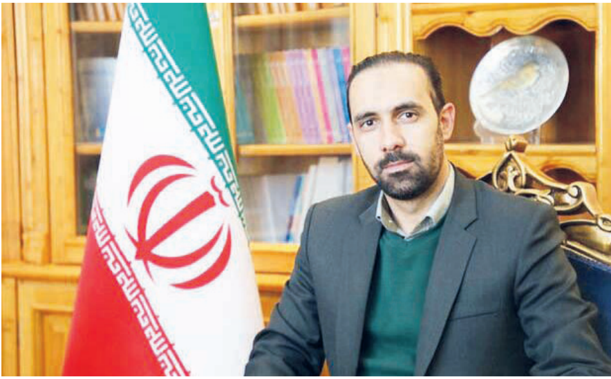
در گفت و گو با مدیرعامل شرکت توسعه گردشگری ایران مطرح شد: