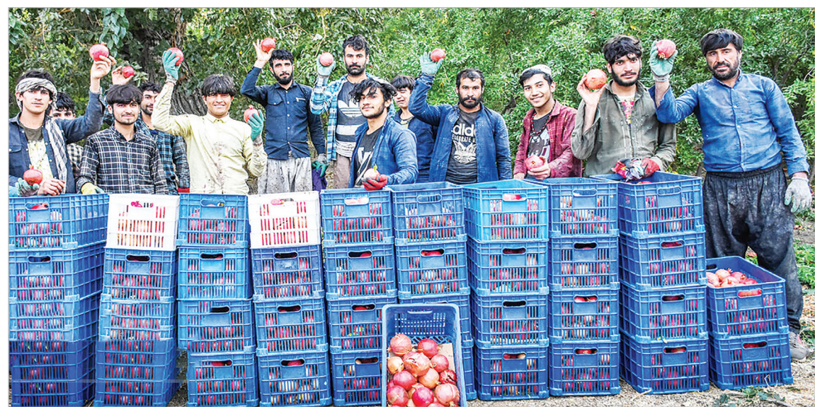
برداشت یاقوت سرخ - ساوه