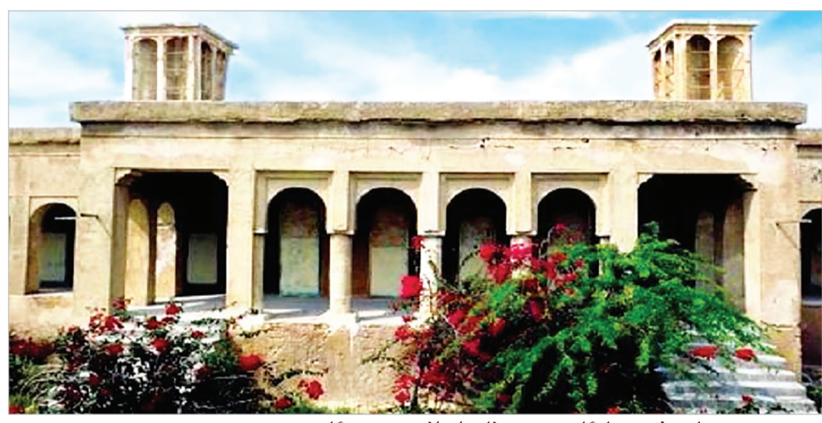
عمارت فکری یادگار عروس بنادر ایرانی در هرمزگان

هیأت دوچرخه سواری کیش به مناسبت گرامیداشت هفته کیش با همکاری مرکز ورزش و تفریحات سالم کیش برگزار می کند.