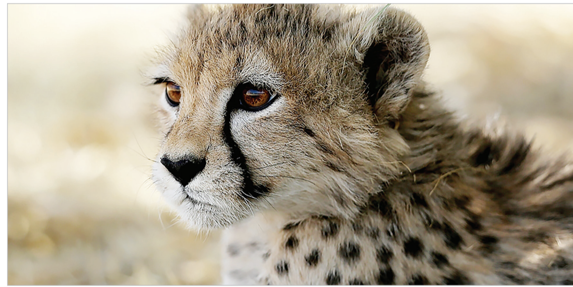
امید به زندگی پیروز، توله یوز ایرانی