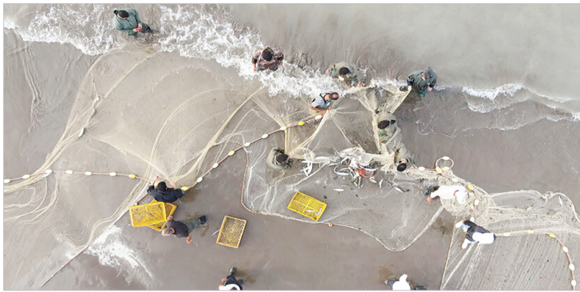
صید ماهی در مازندران