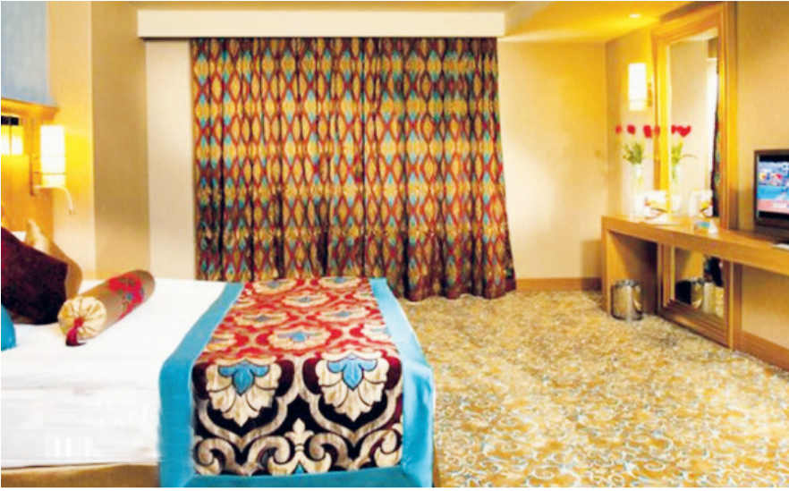
۳۰ درصد هتل های کشور مطابق ضوابط سال ۱۳۹۶ درجه بندی شده؛