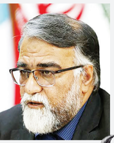
دکتر سعید پورعلی

بعد از مدت ها کاش و قوس رسانه ای و حرف و حدیث ها در مورد تغییر و تحول مجدد در مدیریت دبیر خانه شورای عالی مناطق آزاد، با حکم وزیر امور اقتصاد و دارایی، سید نصرالله ابراهیمی، به عنوان سرپرست دبیر خانه شورای عالی مناطق آزاد منصوب شد. این تغییر و تحول در حالی رخ داد که انتظار فعالان اقتصادی مناطق آزاد در طول ۱۳ ماه مدیریت سعید محمد، بانهگاه به سابقه و صیغه اجرایی و وزن او در فضای سیاسی کشور، برای بازنگری جایگاه مناطق در نظام اجرایی و اعمال برخی سیاست های سرزمین اصلی برآورده نشد. امید است که در بدو حضور سعید محمد بسیار پررنگ بود، ولی روز به روز کم رنگ و کم رنگ تر شد. ۱۳ ماه طایلی که با بیم و امیدهای بسیار همراه بود.