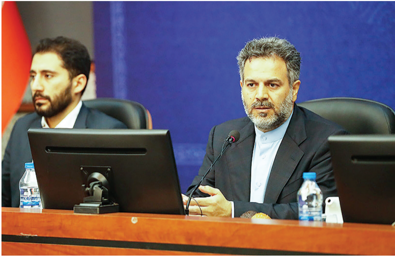
اقتصاد کیش - سرپرست شورای عالی مناطق آزاد تجاری صنعتی و ویژه اقتصادی به تشریح لزوم تشکیل اتاق فکر توسط فعالان اقتصادی و سرمایه گذاران اقتصادی برای سرعت بخشی در رفع موانع مناطق آزاد پرداخت.

نصراله ابراهیمی در نشست هم اندیشی فعالان اقتصادی و نمایندگان اصناف کیش « که در سالن رازی مرکز همایش های بین المللی کیش برگزار شد، فعالان اقتصادی را با زبون توانمند و ارزشمند و محرک در نظام اقتصادی عنوان کرد و گفت: فعالان اقتصادی در شرایط سخت و در جذب سرمایه گذاری خارجی حدود ۱۰ درصد و عدم تکمیل زیر ساخت های ارتباطی و انرژی را یکی