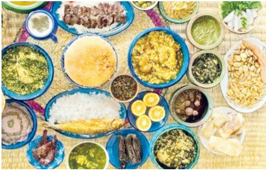
مدیرکل گردشگری داخلی خبر داد: