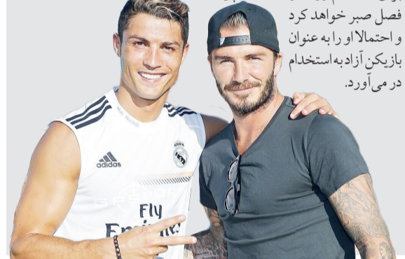
فصل صبر خواهد کرد و احتمالا او را به عنوان بازیکن آزاد به استخدام در می‌آورد.

گروه ورزشی - فوق‌ستاره فوتبال انگلیس به دنبال جذب کریستیانو رونالدو است تا وی را از شرایط سخت بازی در منچستر یونایتد نجات دهد. کریستیانو رونالدو که با تیم منچستر یونایتد به دنیای فوتبال معرفی شد و در رئال مادرید به اوج رسید، بعد از یک دهه به جمع شیاطین سرخ بازگشت تا شکوه گذشته خود را با این تیم تکرار کند. هر چند که فصل نخست حضور رونالدو در جمع منچستر یونایتد درخشانش بود اما با حضور ازیک تن‌هاخ در منچستر، وی به نیمکت‌نشین محض تبدیل و از شرایط خود بسیار ناراضی است. روزنامه دلی استار انگلیس با اشاره به این نیمکت‌نشین نوشت: دیوید بکام تنها کسی است که می‌تواند رونالدو را از جهنم منچستر نجات دهد. بکام مالک باشگاه ایتز میامی در لیگ فوتبال آمریکا است و تاکنون ستاره‌های زیادی از فوتبال اروپا و جهان به خدمت گرفته است. یکی از این ستاره‌ها گونزالو هیرگوان است که چند روز پیش اعلام بازنشستگی کرد. در ادامه گزارش آمده است: فوق‌ستاره پرتغالی فوتبال جهان می‌تواند جایگزین خوبی برای هیرگوان باشد اما مبلغ قرارداد این بازیکن بسیار بالا است. بالا بودن بند قرارداد رونالدو موجب شده تا این بازیکن نتواند در نقل و انتقالات ژانویه راهی لیگ آمریکا شود. بکام برای استخدام رونالدو احتمالا تا پایان فصل صبر خواهد کرد