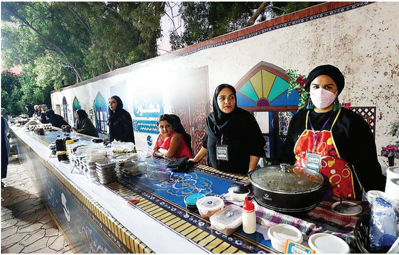
خود سرپرست و بد سرپرست تحت پوشش نهادهای حمایتی قرار می گیرد.

■ اقتصاد کیش - نخستین بازارچه هفتگی صنایع دستی، دست سازه ها و غذاهای محلی کیش با عنوان مهنورا برپا شد.