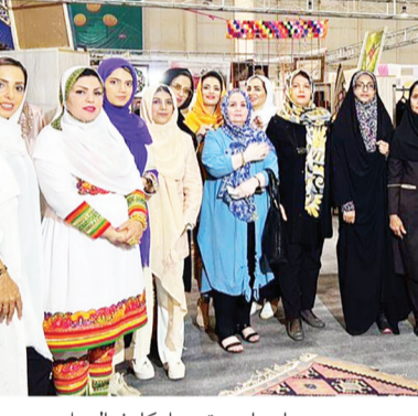
بازرایی و تسهیل کار فعالین این حوزه گام های ارزشمندی برداریم

استان هر مزگان در بندر لنگه و جزیره کیش اظهار داشت: هدف از شرکت در این نمایشگاه معرفی کانون زنان بازرگان حضور معاون صنایع دستی وزیر میراث فرهنگی، گردشگری و صنایع دستی، حمل و نقل کشاورزی استان و تقویت حوزه های می باشد. وی افزود حضور پررنگ صنایع دستی و گردشگری ما برای معرفی توانایی های بانوان هنر مند استان هر مزگان و از تباط بیشتر آنها با فعالین و صادر کنندگان می باشد. رئیس کانسون بانوان بازرگان استان هر مزگان در پایان بیان داشت: امید