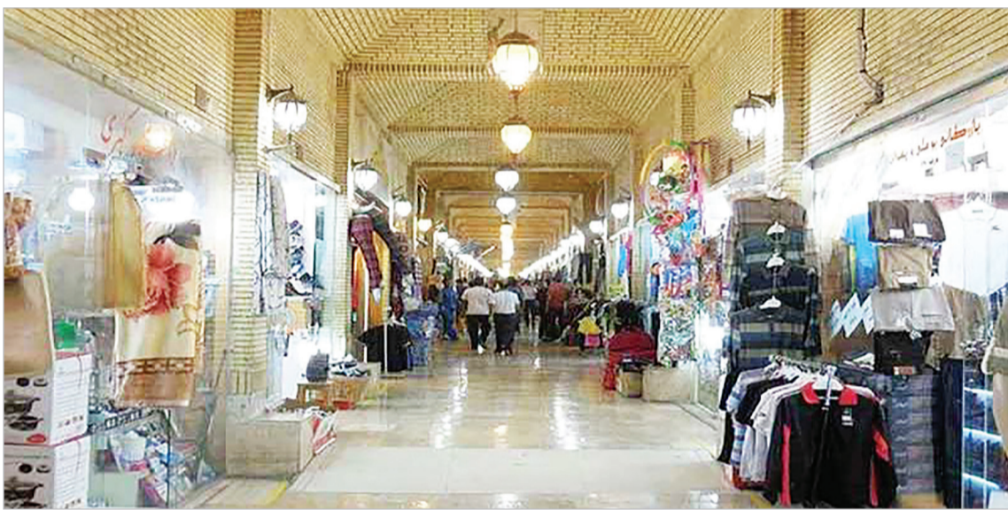
جزیره زیبای کیش - بازار عرب ها