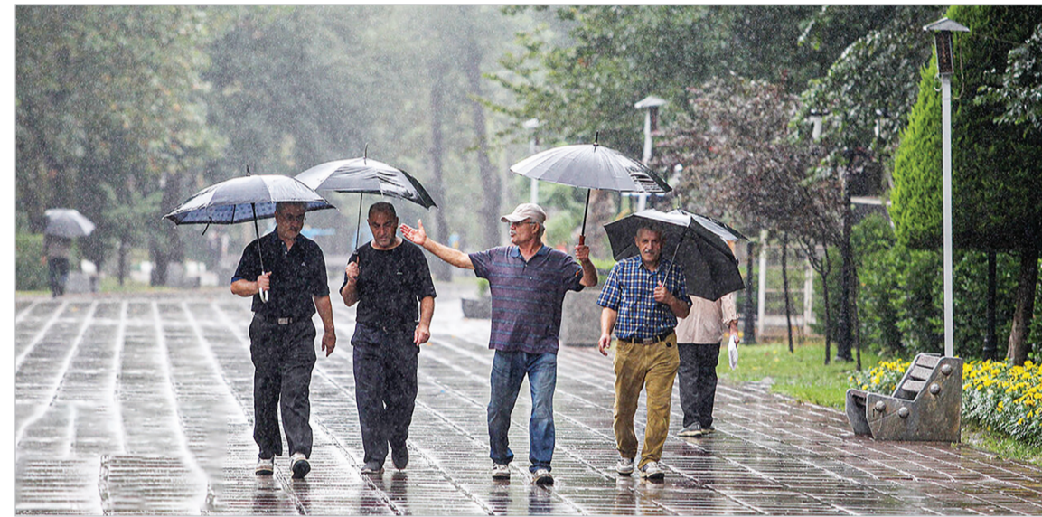
باران تابستانی در رشت