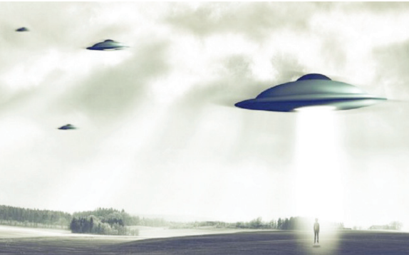
موجود است که "کاپیرو" در آن تعداد تمدن‌های مخرب فرازمینی را تخمین زده است.

و آن اینکه کار "کاپیرو" بیشتر یک آزمایش فکری و ادعا است و توسط ستاره شناسان تأیید نشده است. هدف وی از این تخمین نیز این است که تعداد تمدن‌هایی را که احتمالاً می‌توانند به پیام‌هایی که ما ارسال می‌کنیم واکنش نشان دهند، حدس بزنند و مشخص کنند در واقع یک عدد روی این فرضیه بگذارد. "کاپیرو" که در واقع دانشجوی رشته حل تعارض در دانشگاه "ویگو" در اسپانیا است، برای رسیدن به این عدد، تعدادی را از رشته تحصیلی رسمی خود به رشته‌ای که به آن علاقه دارد تعمیم داده است. وی تعداد برخوردی سیارکی را که برای