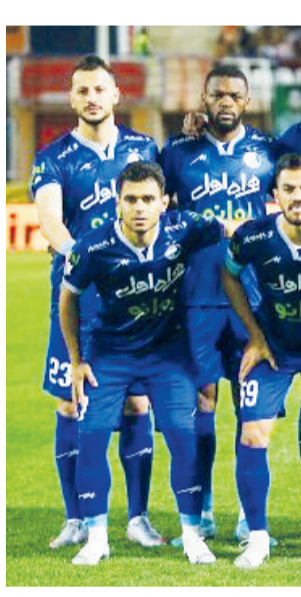
که در این پست انجام می‌دهند از اسم و رسم خوبی هم برخوردار باشند. آبی‌ها می‌توانند از امروز رسماً وارد بازار نقل و انتقالات شوند.

گروه ورزشی - با اینکه در آستانه هفته پایانی لیگ برتر هستیم، فرهاد مجیدی هنوز به صورت رسمی لیستی را برای خرید در اختیار باشگاه قرار نداده است. تمرکز فرهاد مجیدی برای قهرمانی در فصل بیست و یکم و حفظ آمارها و رکوردهای خوب تیمش در این فصل باعث شده وی کمتر تا قبل از پایان فصل به مقوله نقل و انتقالات ورود کند. با این حال قطعاً سرمربی موفق و جوان آبی پوشان که به دلیل عملکردش در این فصل بر میزان محبوبیتش افزوده شده نیم نگاهی هم به نقل و انتقالات داشته باشد. در خصوص نقل و انتقالات و سبد خرید استقلال گمانه زنی‌هایی صورت گرفته و برخی اسامی هم برای پیوستن به این تیم مطرح شده است که عمدتاً این اسامی را می‌توان بازار گرمی دانست. یکی از پست‌هایی که به نظر می‌رسد مجیدی برای تقویت تیمش اقدام به خرید بازیکنی با تجربه خواهد کرد، هافبک میانی طراح و بازیگر دان است. پستی که در یکی دو سال اخیر آبی‌ها در آن احساس خلا می‌کنند. یکی از خریدهای قطعی استقلال‌ها برای فصل آینده هافبک میانی با این ویژگی‌هاست و علاوه بر این، آبی‌ها علاقمند هستند خریدی