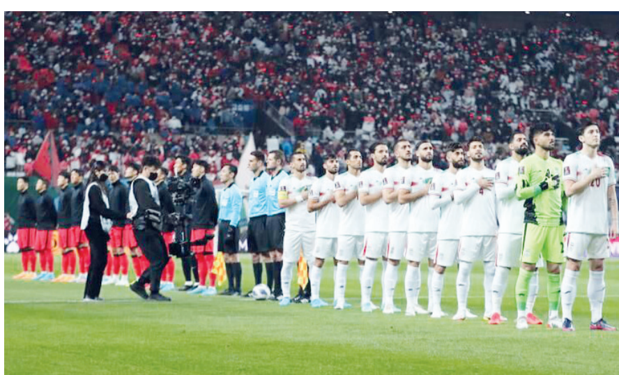
مثل عربستان، مسابقه‌ای با کیفیت در آستانه جام بیست و دوم تجربه خواهد کرد.

گروه ورزشی - تیم ملی فوتبال ایران در فاصله ۱۷۵ روز تا آغاز جام جهانی ۲۰۲۲ قطر هنوز نتوانسته بازی دوستانه‌ای را برای حضوری هر چه بهتر در این تورنمنت داشته باشد. قرار بود شاگردان درآگان اسکوپچ در پنجره پیش رو در خردادماه مقابل کانادا و حتی اکوادور به میدان بروند اما بازی دوم پیش از قطعی شدن و دیدار اول پس از قطعی شدن به دلایل مختلف منتهی شد تا حالا ما تنها تیم آسیایی باشیم که در این پنجره بازی دوستانه نداریم. فیفا برای پنجره جاری، چهار مسابقه دوستانه را برای تیم‌های پیش‌بینی کرده بود. رقیب آسیایی ما هم هر کدام برنامه مدونسی را پیش‌بینی کرده‌اند. عربستان به اسپانیا رفته و ۲ مسابقه برگزار می‌کند. ژاپن و کره در کشور خودشان چهار بازی ایده‌آل را ترتیب داده‌اند. قطر هم قرار است به مصاف برزیل و آرژانتین برود.