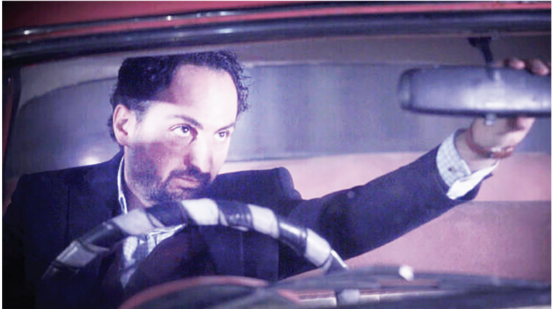
معاملاتی ارابه و از تمام ظرفیت این گونه برنامه‌ها که کم شبکه سه سیما است، هر روز حوالی ساعت ۱۷ روزی آنتن شبکه سه سیما می رود.