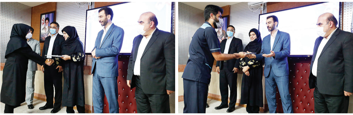
رئیس بیمارستان کیش: