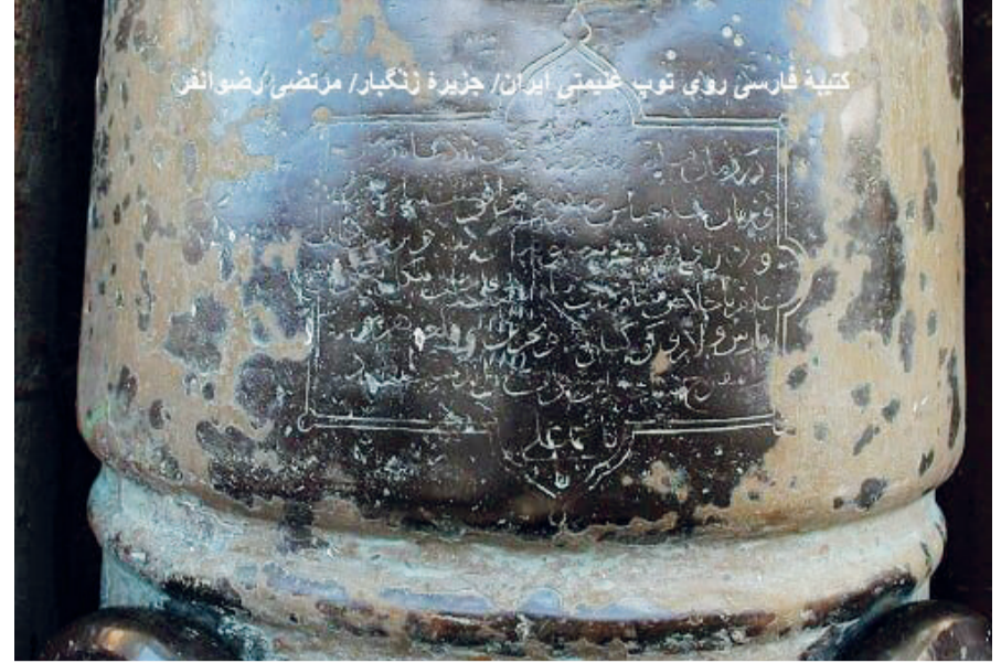
کتیبه فارسی روی توپ عظیمی ایران/ جزیره زنگبار/ مرتضی راضوانفر

به گفته راضوانفر، امام قلی خان و فرزندانش بعدها به طرز فجیعی توسط شاه صفی سر بریده شدند و این سه کتیبه یادگار مانده از او، متأسفانه یکی به دلیل نشستن مردم روی توپ کاملاً محو شده، دومی نیمه‌محو است و سومی نیز در معرض نابودی قرار دارد.