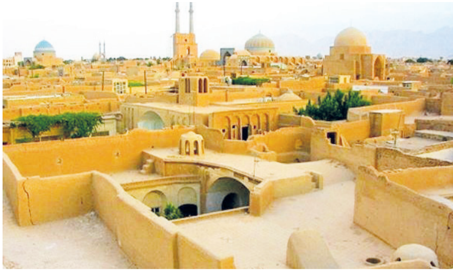
۲۰ شهر در صف پیمان خواهرخواندگی با یزد؛