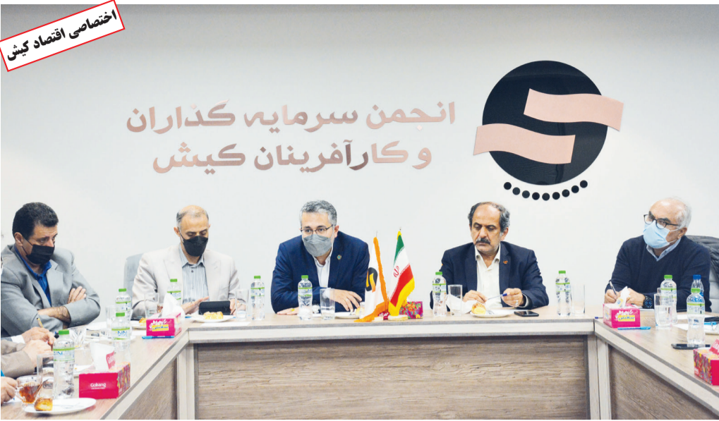
سرپرست معاونت عمرانی سازمان منطقه آزاد کیش در نشست با انجمن سرمایه گذاران و کار آفرینان کیش.