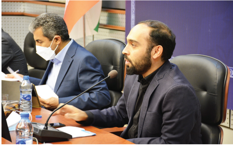
به گزارش اقتصاد کیش، سرپرست سازمان منطقه آزاد کیش در این نشست درخشش کیش به عنوان نگین

اقتصاد کیش - سرپرست سازمان منطقه آزاد کیش در نشست فعالان اقتصادی و سرمایه گذاران کیش با رئیس کمیسیون اقتصادی مجلس شورای اسلامی، گفت: امیدواریم مشکلات مربوط به اجرای قوانین مناطق آزاد با کمک نمایندگان مجلس برطرف شود.