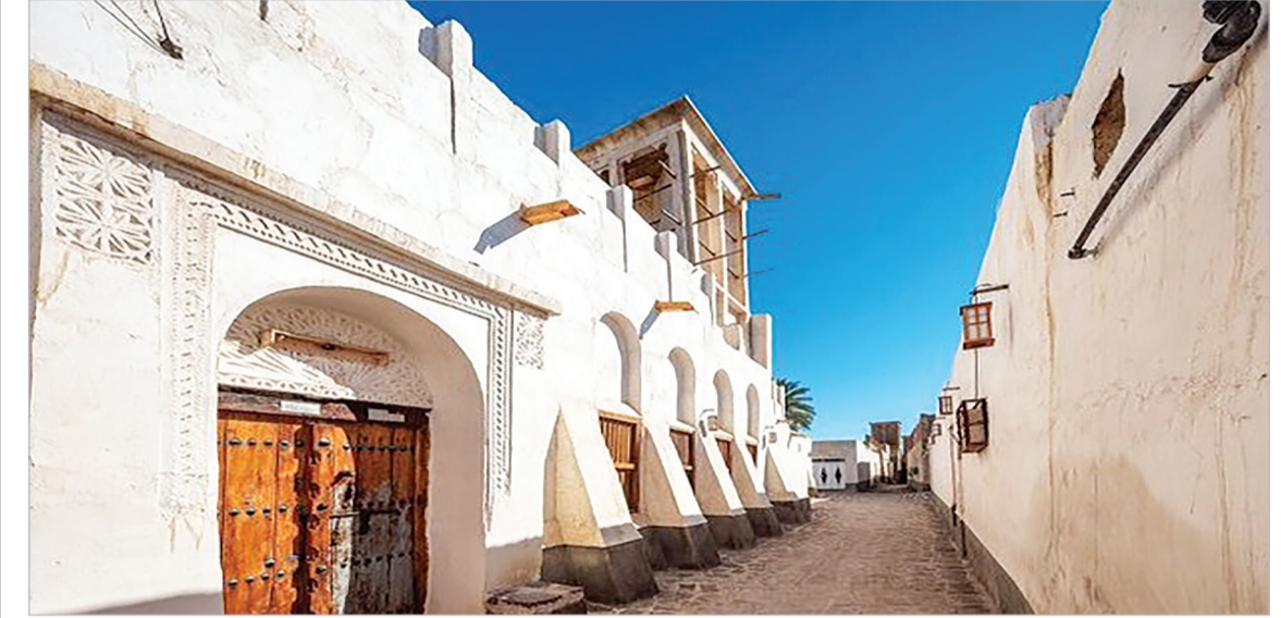
ثبت ملی بنای تاریخی در بندر کنگ