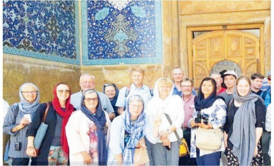
گروه گردشگری - بسا وجود سرعت بخشیدن به طرح واکسیاسیون

رئیس جامعه تورگردانان ایران معتقد است: وقتی حرف از گردشگر به میان می‌آید از دولت صاحب نمی‌کنیم و مردم عادی مدنظر هستند باید بتوانیم برنامه‌هایی برای گنجاندن نام ایران در زندگی عادی روس‌ها که همان گردشگران هستند، پیدا کنیم.