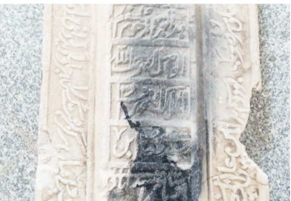
موزه سنگ به منظور نگهداری از سنگ‌های تاریخی در این شهرستان ضروری است اما تاکنون به دلیل عدم وجود فضای کافی این امر مهم در شهرستان محقق نشده است.

مژده سنگ به منظور نگهداری از سنگ‌های تاریخی در این شهرستان ضروری است اما تاکنون به دلیل عدم وجود فضای کافی این امر مهم در شهرستان محقق نشده است. وی با بیان اینکه متأسفانه نبود مکان کافی و مناسب موجب عقب