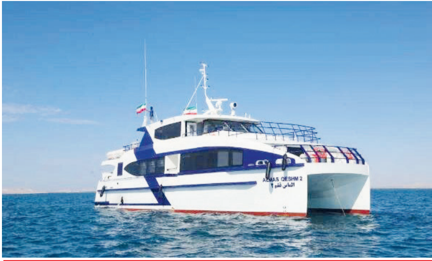
عضویت عامل سازمان بنادر و دریانوردی مطرح کرد:

انجام تمهیدات لازم به منظور افزایش ظرفیت مسافری به گفته سرپرست معاونت امور دریایی سازمان بنادر و دریانوردی، نظارت‌های مستمر و میزبانی آمان و بنادر، بازرسی شناورها قبل از شروع سفرهای دریایی نوروزی و انجام تمهیدات لازم به منظور افزایش ظرفیت مسافری از فعالیت‌های عمده این کمیته