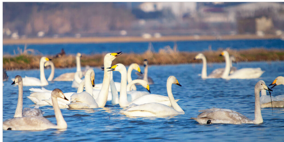
بازگشت قوهای فریادکش به تالاب سرخورد - احسان فضلی اصانلو