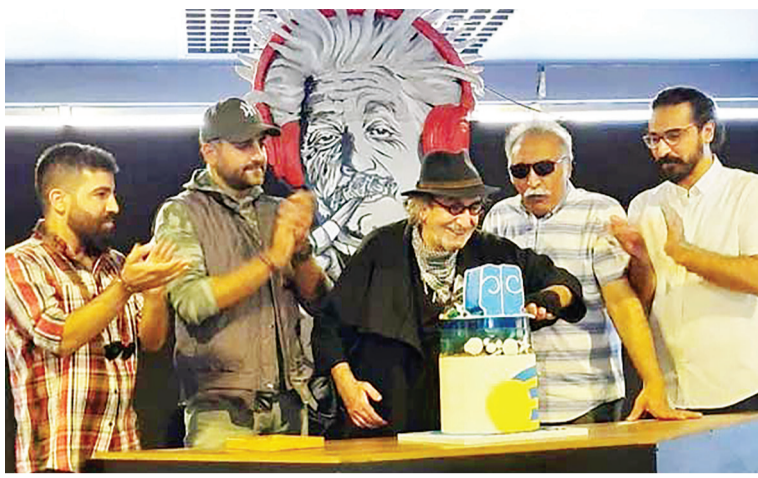
اقتصاد کیش - چهارمین جشنواره ملی تئاتر کوتاه کیش برگزار شد.