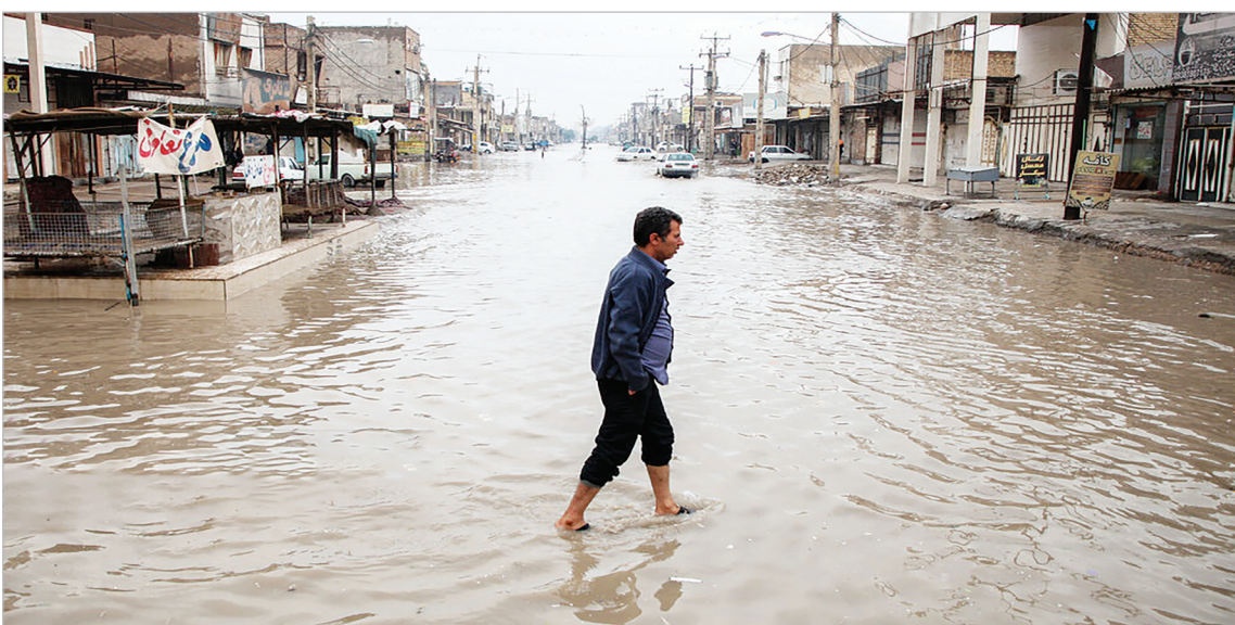
اهواز غرق در آب