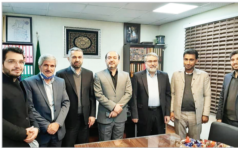
در حال حاضر ۸۷ هزار و ۵۰۰ خانوار تحت پوشش کمیته امداد هرمزگان هستند که از این تعداد ۹ هزار و ۶۳۷ خانوار ایام می باشند