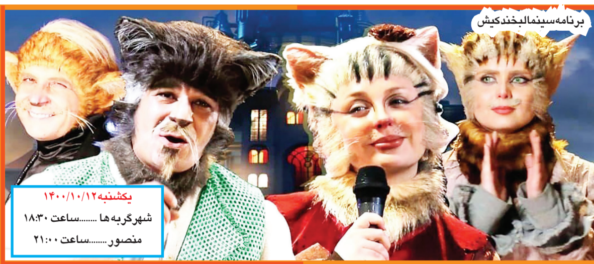
برنامه سینمالبخند کیش