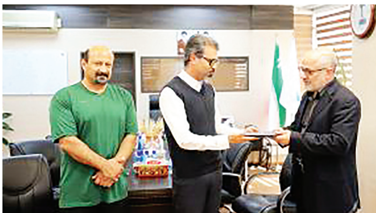
مسئولیت مدیریت حمل و نقل عمومی کیش را بر عهده داشت.

روابط عمومی سازمان منطقه آزاد کیش اعلام کرد: