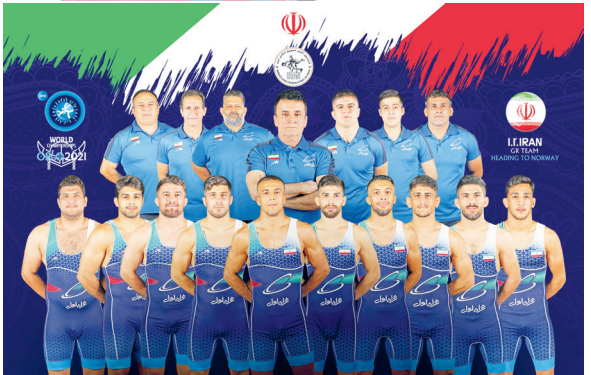
اوکراین، تیم ملی کشتی آزاد روسیه و تیم کشتی زنان ژاپن را در کنار تیم ملی کشتی فرنگی به عنوان برترین تیم های جهان در سال ۲۰۲۱ قرار داد.

گروه ورزشی - گاری با ۱۷ سال سن در میانه زمین بارسا شگفت انگیز کار می کند. او مثل یک مبارز وحشی، تیمش را روی دوش خود به جلو پیش می برد. فرصت ها در فوتبال برای استفاده کردن است و این همان کاری است که گاری در بارسا به خوبی آن را انجام داده و با سرعت نیز به جلو پیش می رود. بارسا فصل جاری تحولاتی بزرگ را به خود دیده و در این تیم شاهد یک انقلاب هستیم. حالا نه لیونل مسی در بارسا حضور دارد و نه ستاره های بزرگی که لوزه بر تن رقبا می انداختند و لسی در عوض فرصت به بازیکنان جوان و بعضاً محصول آکادمی لاماسیا همچون گاری رسیده است. گاری به