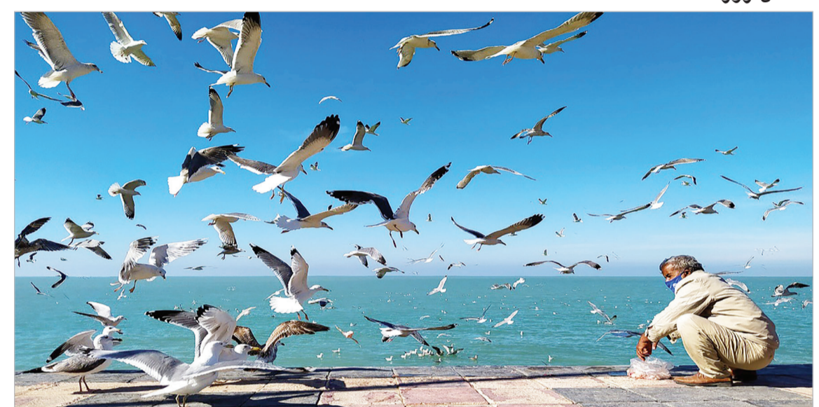
خلیج فارس میزبان شالوهای مهاجر - افسانه جعفری