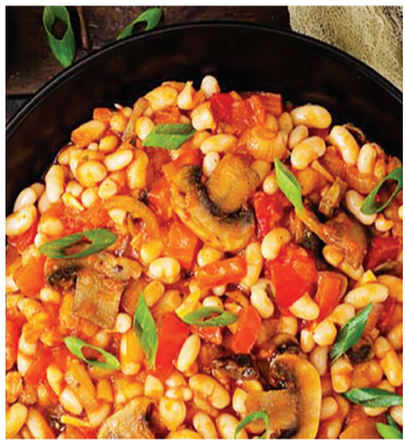
کرده و سرو کنید.

این خوراک گیاهی دلچسب چیزهای زیادی برای ارائه دارد، از جمله فیبر، آهن، پتاسیم، ویتامین‌های K و A.C همچنین می‌تواند آن را تنها در ۳۰ دقیقه بپزید. در یک قابلمه بزرگ، ۲ قاشق غذاخوری روغن زیتون را روی حرارت متوسط رو به بالا گرم کنید. ۱ عدد پیاز زرد خرد شده را اضافه کنید و ۵ تا ۶ دقیقه تفت دهید و مرتباً هم بزنید تا شروع به نرم شدن کند. ۲ حبه سیب‌خرد شده، ۴ عدد هویج ۱ سانتی خرد شده و ۳ ساقه کرفس خرد شده را اضافه کنید و ۶ دقیقه دیگر به پختن ادامه دهید و هر از گاهی هم