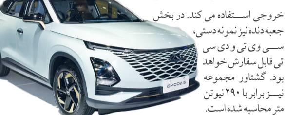
خروجی استفاده می کند. در بخش جعبه دنده نیز نمونه دستی، سسی وی تی و دی سسی تی قابل سفارش خواهد بود. گشتاور مجموعه نیز برابر با ۲۹۰ نیوتن متر محاسبه شده است.