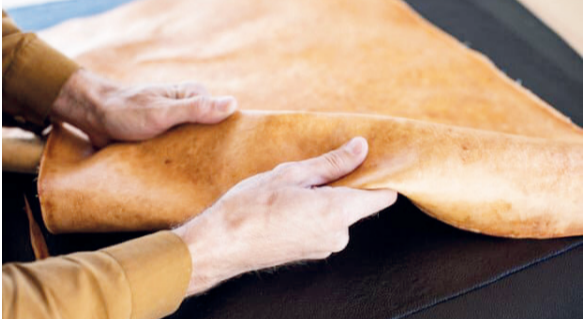
دلمسداری را به همراه دارد. محصولات چرمی سازگار با محیط زیست برای افراد و گان نیز مناسب خواهد بود. این افراد از گوشت حیوانات و هیچ یک از فرآوردهای مرتبط با حیوانات مانند