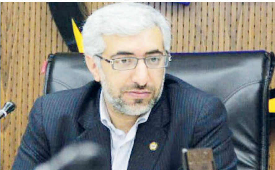
رئیس سازمان بورس تشریح کرد؛

و توسعه برنامه‌های بازار در توسعه نگاه‌ها از بستر بازار سرمایه؛ تنوع‌بخشی و تعمیق بازار سرمایه (در ابعاد بازار، ابزار و نهاد)؛ افزایش شفافیت و کیفیت اطلاعات منتشر شده در بازار سرمایه؛ مقررات‌زدایی، اصلاح فرآیندهای کاری و افزایش کارایی بازارهای مالی؛ توسعه نهادهای مالی و انحصارزدایی؛ توسعه و تقویت زیرساخت‌های فنی؛ تسهیل‌گری و