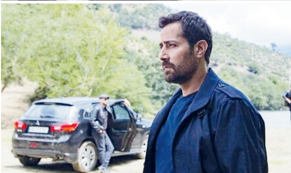
از «۸۷ متر» تا «سامو بندری»!