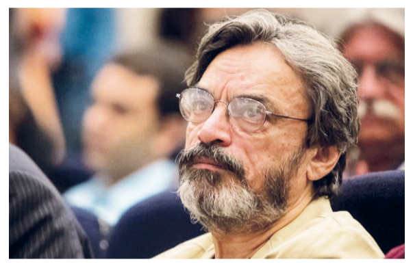
گروه فرهنگ و هنر - آلبوم موسیقی «دلنواز» با اجرای آثاری از پیشگام موسیقی ایرانی و یادداشتی

ترمیم نواهای جاوید مورد توجه عام و خاص در دل تاریخ ماندگار