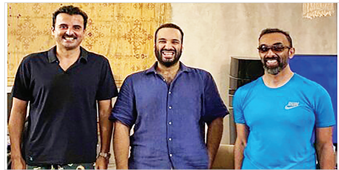
عکس جالب! از چپ: امیر قطر - ولیعهد عربستان سعودی - مقام اماراتی